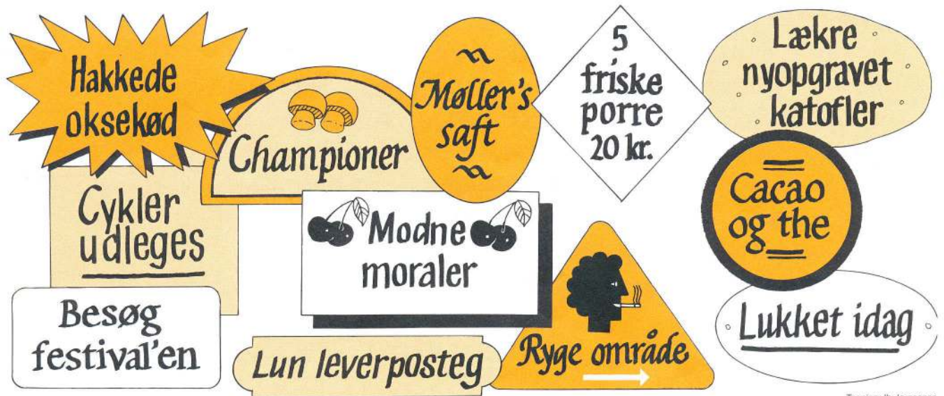
Tegning: Ib Jørgensen

Der er fejl på alle disse skilte. Udfyld de tilsvarende skilte nedenunder så teksten bliver korrekt. (Skriv med store og små bogstaver som skiltene viser).